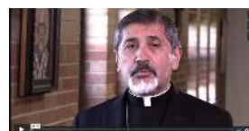
Mensaje del Obispo Rodríguez

El Arzobispo Aquila y el Obispo Rodríguez comparten un mensaje especial de gratitud por el continuo apoyo de sus feligreses.