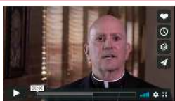
Mensaje del Arzobispo Aquila

El Arzobispo Aquila y el Obispo Rodríguez comparten un mensaje especial de gratitud por el continuo apoyo de sus feligreses.